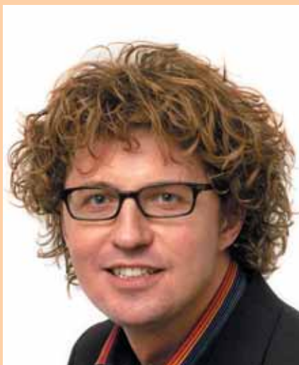
Wethouder Sander Dekker Wethouder van Onderwijs, Jeugdzaken en Sport. Stadsdeelwethouder Leidschenveen-Ypenburg.