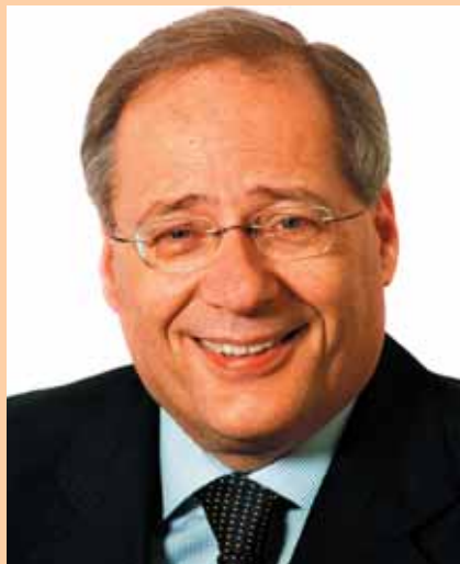
Burgemeester Wim Deetman

Verantwoordelijk voor Openbare Orde en Veiligheid, Algemene Bestuurlijke Aangelegenheden en Representatie.